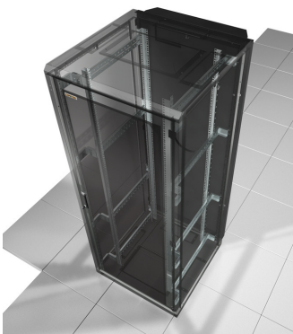
Bagside rack monteret køling