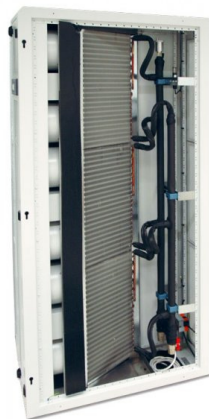
Mellem rack monteret køling