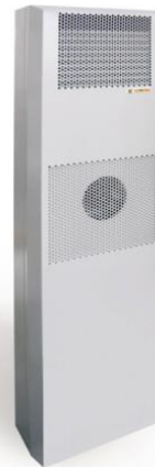
Sidemonteret Aircondition køling