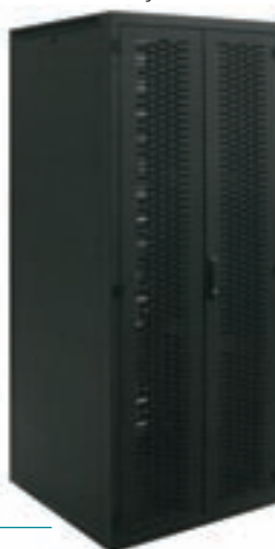
Et rack med to svingdøre á f.eks. 400 mm i hver side er pladsbesparende.